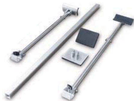
Art. 07700500 Kit bracci supporto laterali con piattelli in gomma Side supporting arms with pads