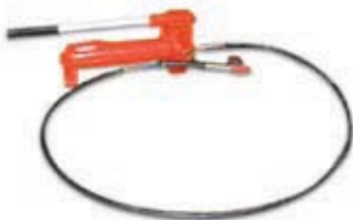
Art. 07700100 Kit pompa 4 ton. con tubo ad alta pressione Kit with hydraulic pump including high pressure hose.