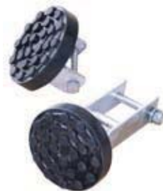
Art. 07700300 Kit contrasto tamponi Pair of rubber pads