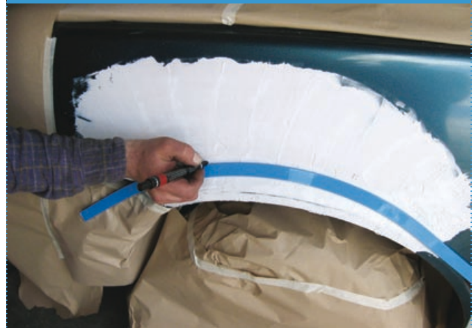
Fase | Step 2

Applicare la striscia magnetica seguendo il profilo originale e tracciare una linea di lavoro con la matita Apply magnetic strip along the original profile and sign a working line by pencil