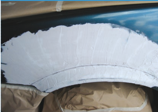
Fase | Step 3

La zona da levigare e profilare è chiaramente e velocemente segnata Working area is clearly and quickly indicated by a secure pencil sign