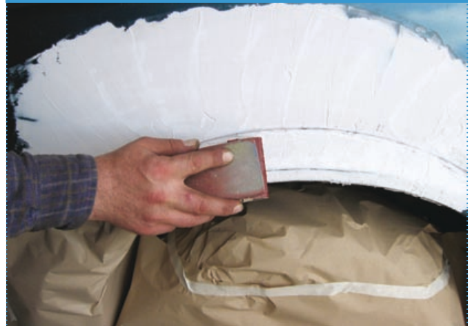
Fase | Step 4

Levigatura e riprofilatura del lamierato Grinding and reprofiling of panel sheet