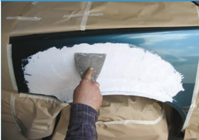
Fase | Step 1

Esempio di riprofilatura della modanatura originale | Example of reprofiling of original mouldings