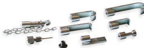
Art. 211 | Kit Ganci Hook kit