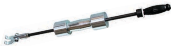
Art. 205 | Martello di tiro 7kg. Slide hammer 7 kg.