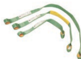
Art. 900 | Cinghie di tiro Pull straps