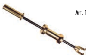
Art. 171 | Martello di tiro Slide hammer